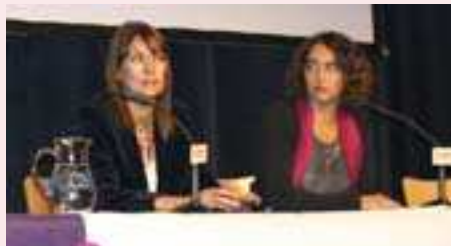
MABEL LOZANO DURANTE EL COLOQUIO

Además de la acción "Zapatos Rojos", en el marco de la campaña nacional "Mujeres Libres, Mujeres en Paz", el 3 de diciembre de 2015 se proyectó en Zaragoza el documental, dirigido por Mabel Lozano, "Chicas Nuevas 24 horas", un alegato contra la trata de mujeres y niñas con fines de explotación sexual.